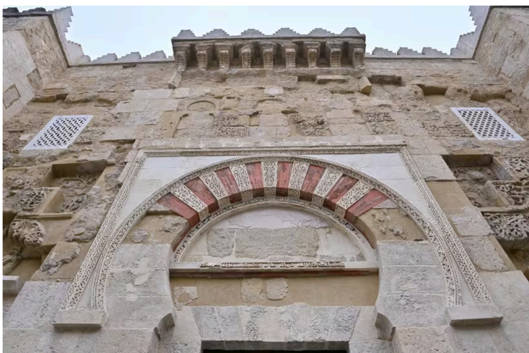
Archivo - Mezquita de Córdoba. - CABILDO CATEDRAL DE CÓRDOBA - Archivo