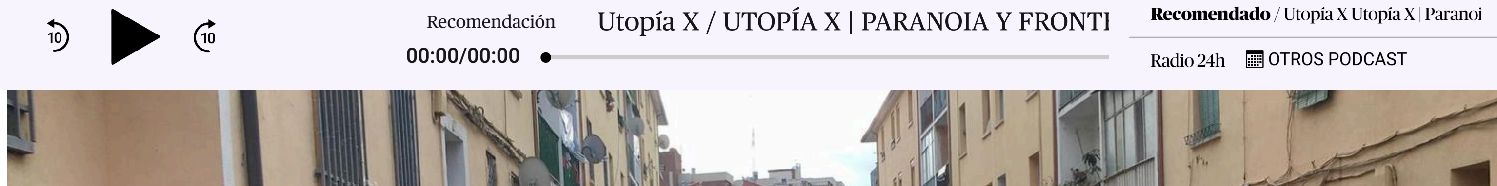
Cientos de personas hicieron noche para evitar el desahucio de Diego Catriel, vecino del barrio del Alamin en Guadalajara.