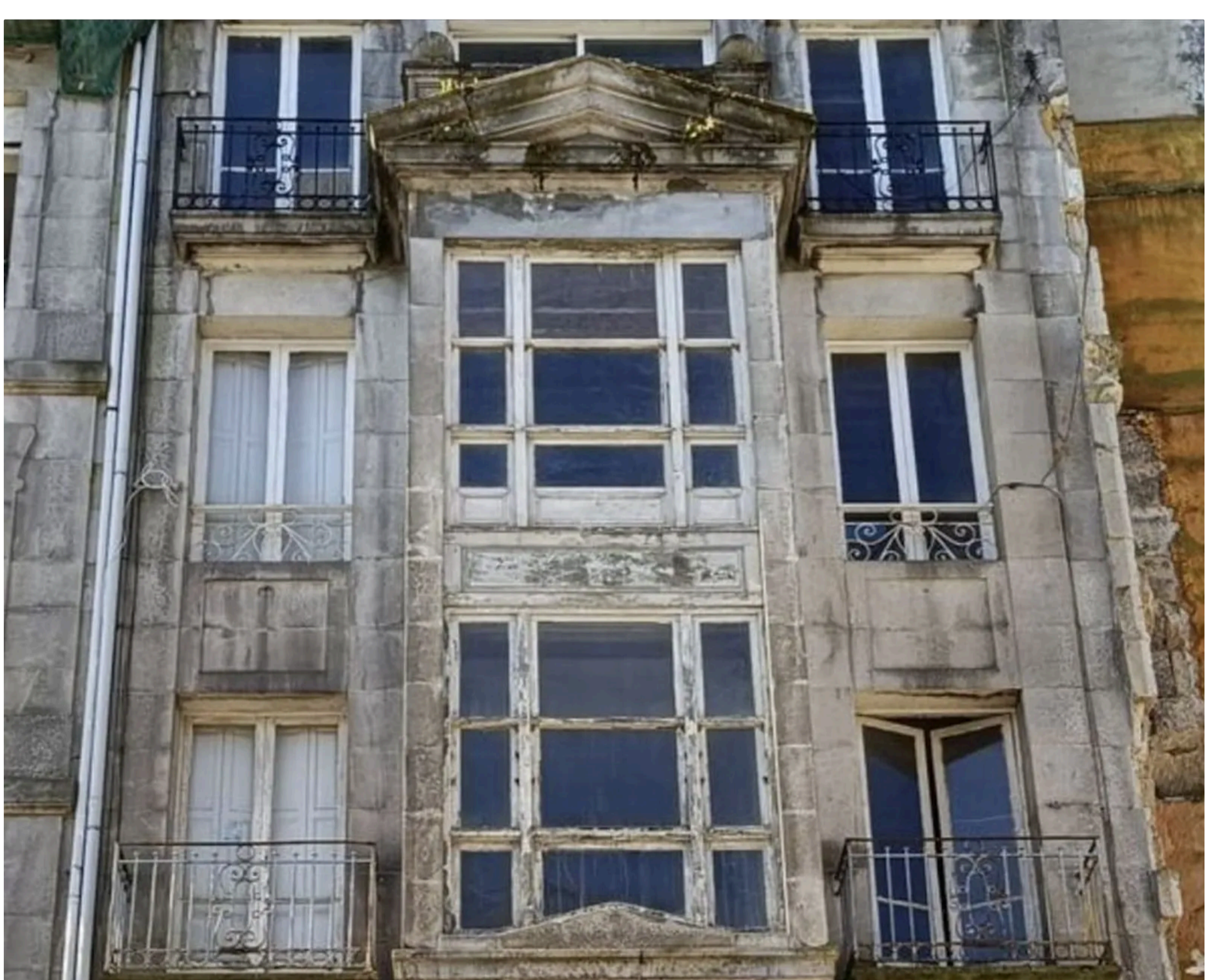
Un edificio de la diócesis de Tui-Vigo a rehabilitar en Vigo | Diócesis de Tui-Vigo

En estos momentos, la mitad de estos inmuebles están en una de estas situaciones.