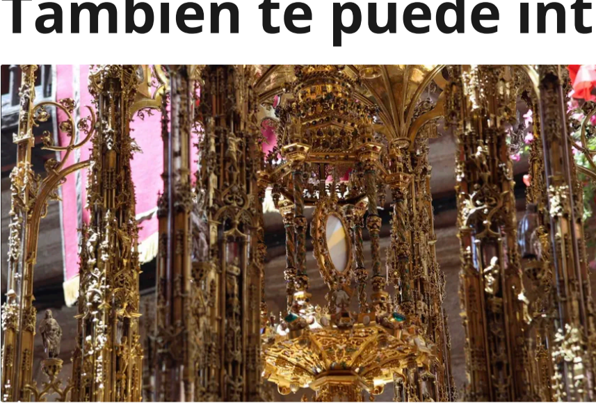
Toledo un Corpus especial con el VIII centenario de su Catedral y la visita del Papa Omnipresentes