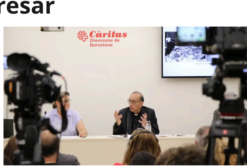
Omella: "El Papa sabe que tiene que hablar algo en catalán"