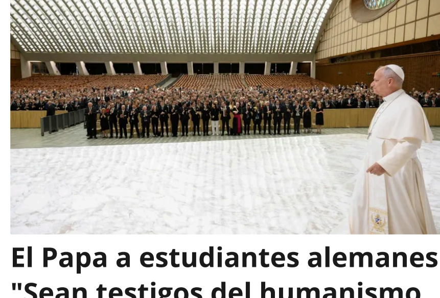
El Papa a estudiantes alemanes: "Sean testigos del humanismo cristiano en las universidades"