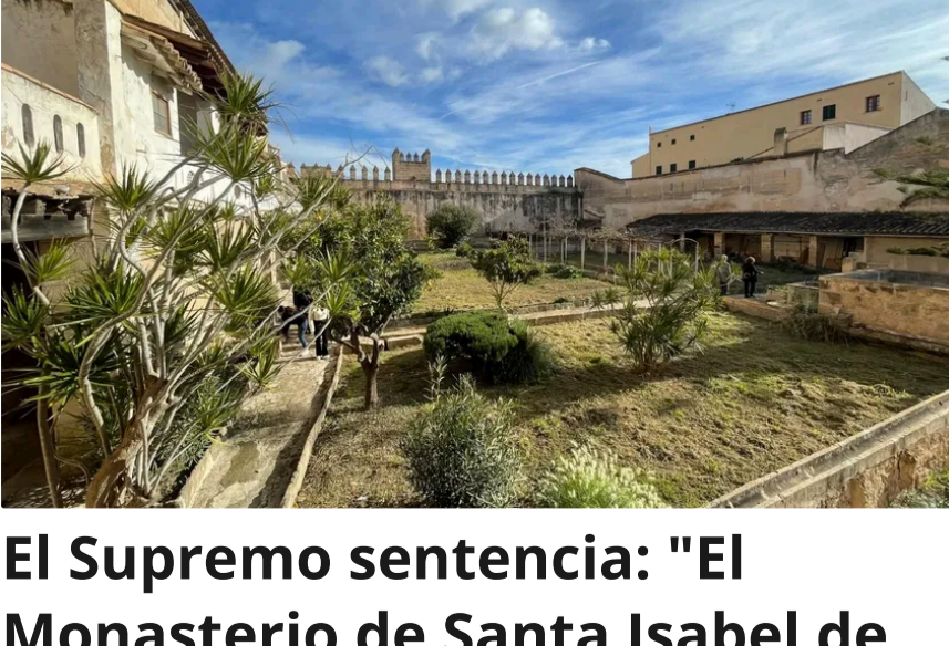
El Supremo sentencia: "El Monasterio de Santa Isabel de Palma de Mallorca es de las jérnimas"