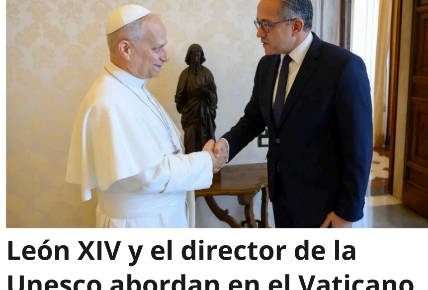
León XIV y el director de la Unesco abordan en el Vaticano los desafíos de la IA