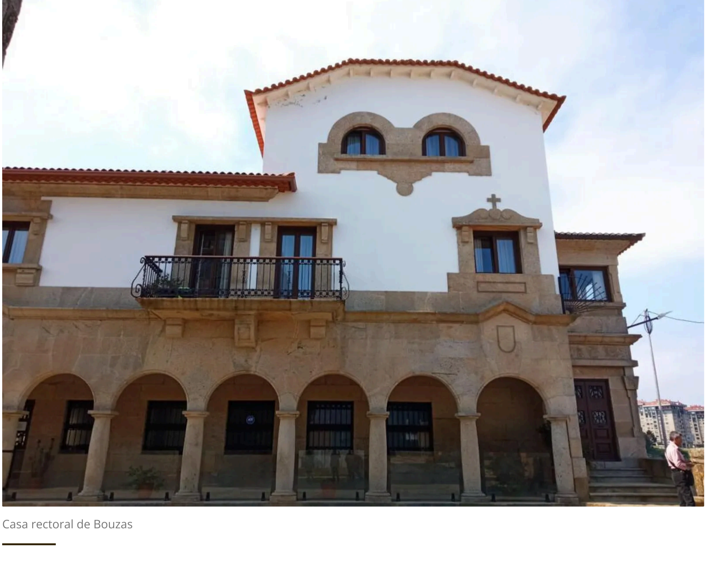
Casa rectoral de Bouzas

Pero tenemos un fenómeno nuevo -nosotros, como todas las diócesis- que es el descenso en el número de sacerdotes en contraposición con la gran generosidad de los cristianos de las generaciones anteriores, que no sin esfuerzo, consiguieron dar vivienda y bienes generacionales (fincas, montes...) para el sostenimiento de sus sacerdotes. Es por ello que hoy nos encontramos con casas parroquiales que quedan vacías y fincas o montes sin explotar. Ello nos lleva a buscar alternativas para que estos bienes que ya no tienen como fin el mantenimiento del sacerdote deriven su objetivo al sostenimiento de la parroquia y sus actividades.