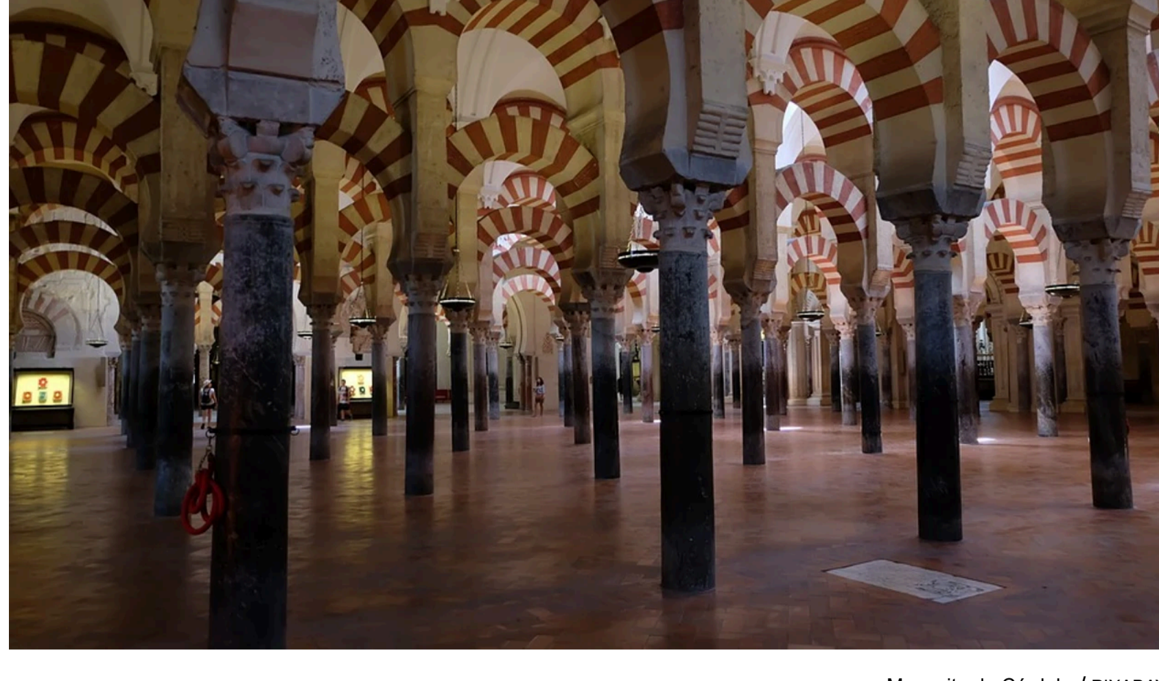
Mezquita de Córdoba

A través de este buscador interactivo puedes acceder a cada una de las 35.000 propiedades que la Iglesia Católica se apropió en toda España.