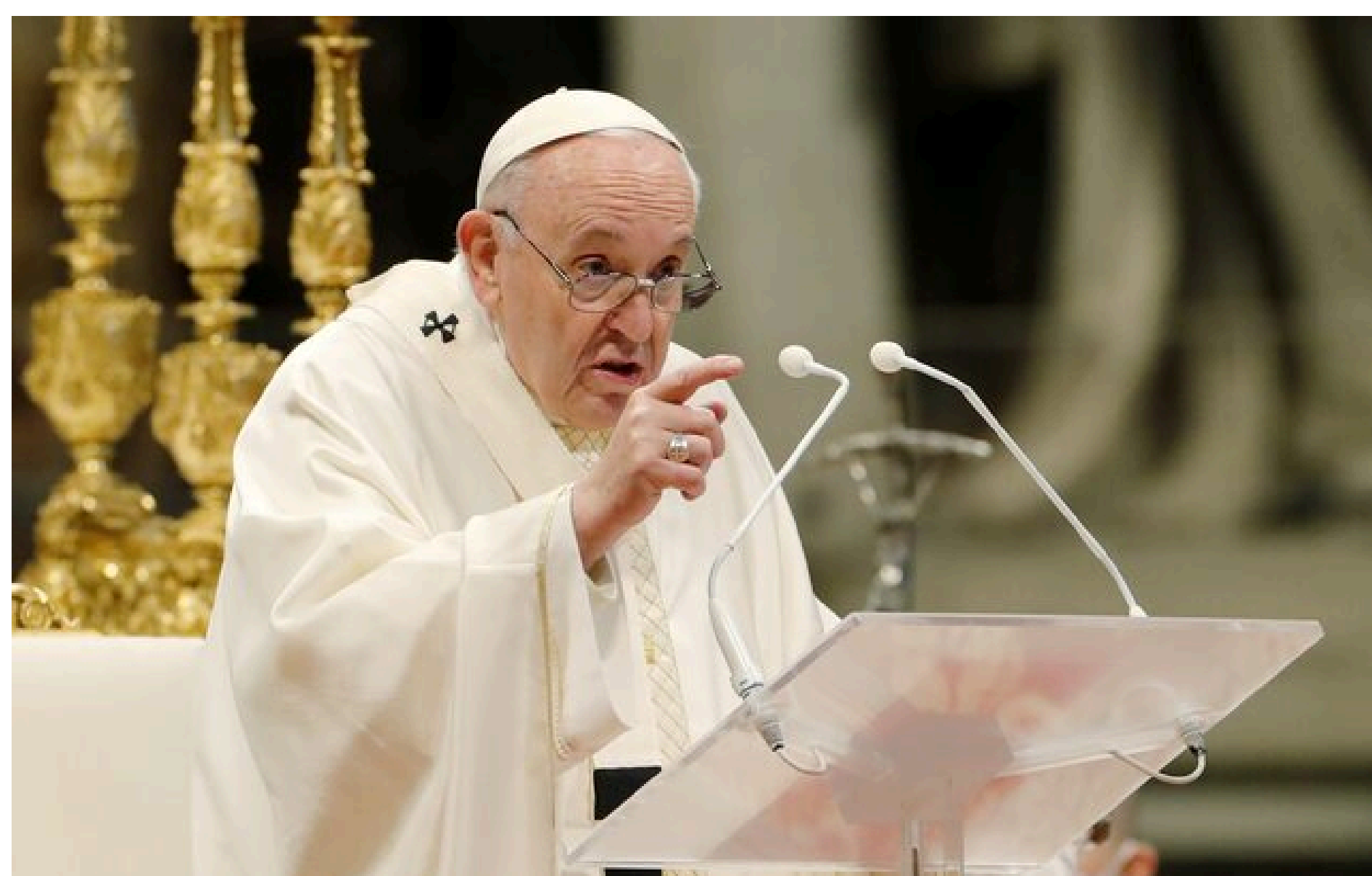
El Papa Francisco dirige una misa en la Basílica de San Pedro, en el Vaticano, el 25 de abril de 2021. REUTERS/Remo Casilli/Foto de archivo Licencia de compra Derechos

30 de abril (Reuters) - El Papa Francisco dictaminó el viernes que los obispos y cardenales que trabajan en el Vaticano serán juzgados por el mismo tribunal laico que conoce de otros casos penales y ya no por un panel de élite de preladados.