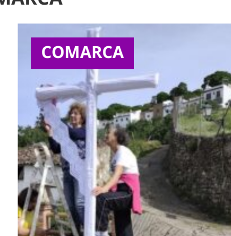
Pujerra recupera la tradición de vestir las Cruces de Mayo