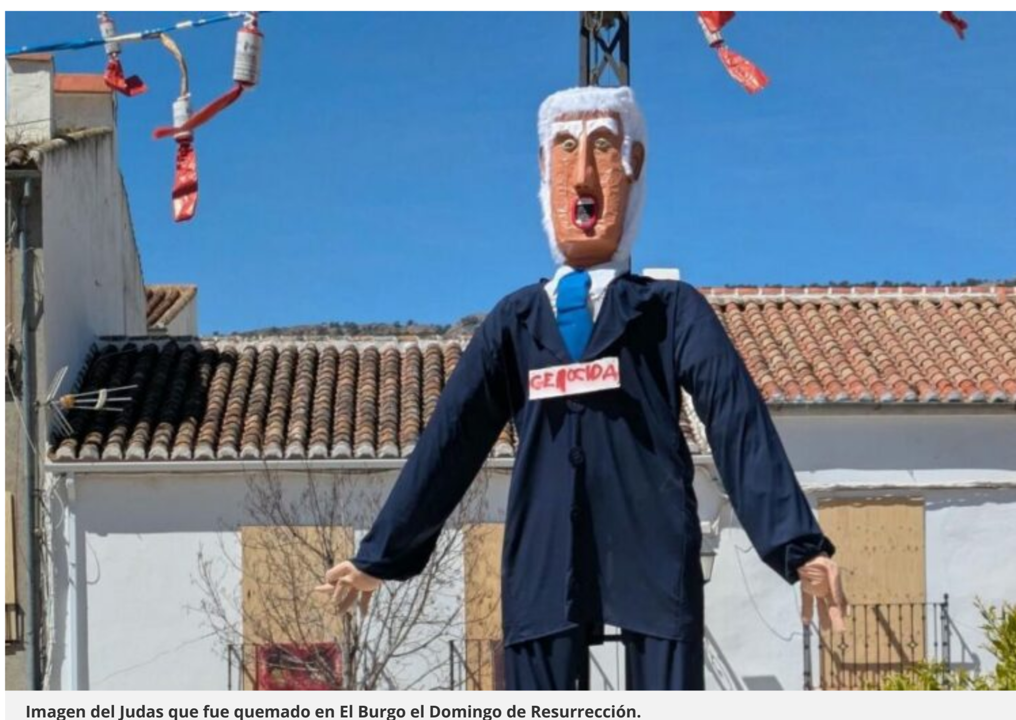
Imagen del Judas que fue quemado en El Burgo el Domingo de Resurrección.