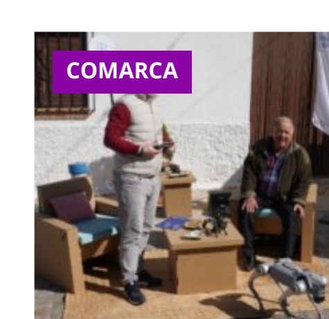
Una red europea incluye a la Serranía de Ronda en un proyecto contra la despoblación

NOTICIAS ANTERIORES Cartajima celebró la VI edición de las Jornadas Micológicas de Primavera con medio centenar de participantes