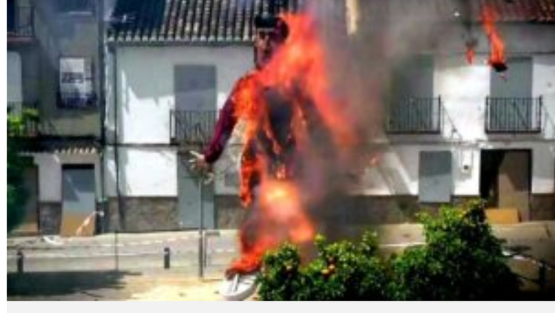
Momento en el que arde el Judas e El Burgo.

La quema simbolizaba el mensaje “No a la guerra, al genocidio”, según dijo la alcaldesa de la localidad, María Dolores Narváez. En 2025, la figura quemada fue la del presidente de Estados Unidos, Donald Trump.