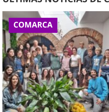
El primer campus rural de la Serranía de Ronda impulsa a jóvenes innovadores hacia el emprendimiento rural