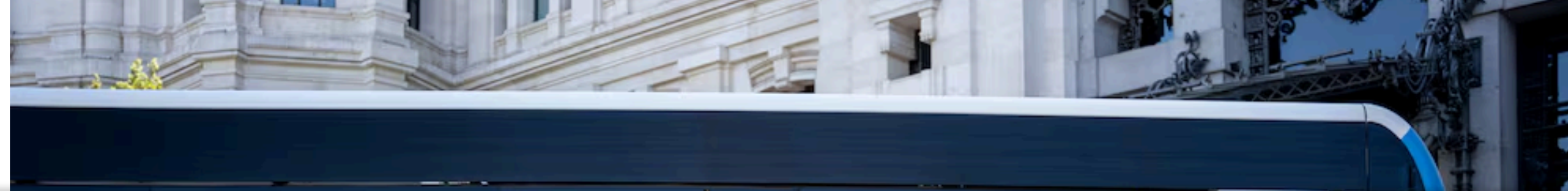
Un autobús aparcado ante el Ayuntamiento de Madrid con la cartelera institucional que lucirá la capital durante la próxima visita oficial del papa León XIV.

La medida, que será aprobada este martes en el Consejo de Ministros, conlleva deducciones fiscales para los promotores del evento