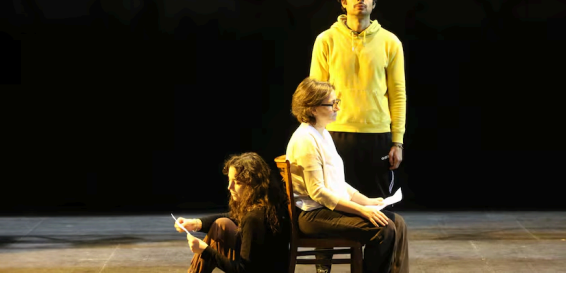
Las becas que dan el impulso definitivo a la creatividad