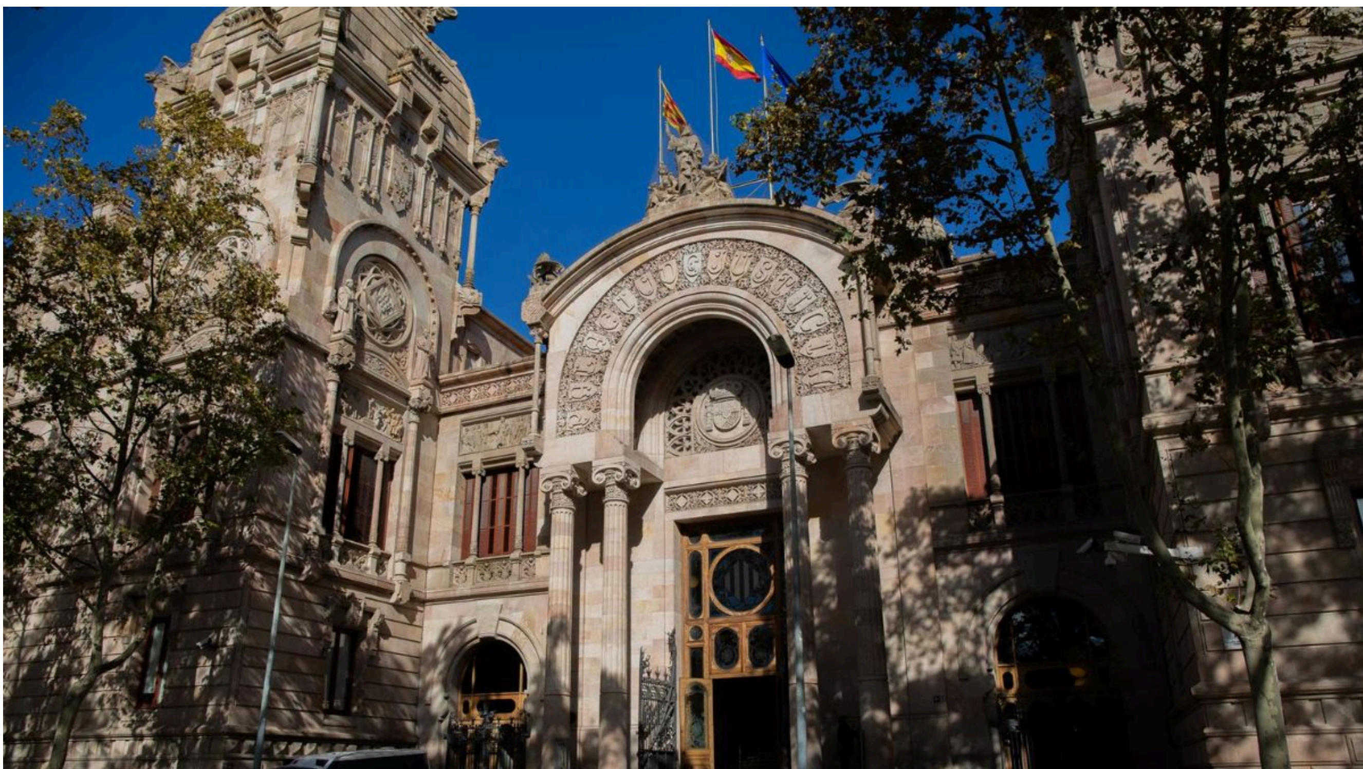
Fachada del Palacio de Justicia de Cataluña, sede del TSJC y de la Audiencia de Barcelona.

La magistrada del Juzgado de lo Contencioso-Administrativo remite el caso al Tribunal Superior de Justicia de Cataluña