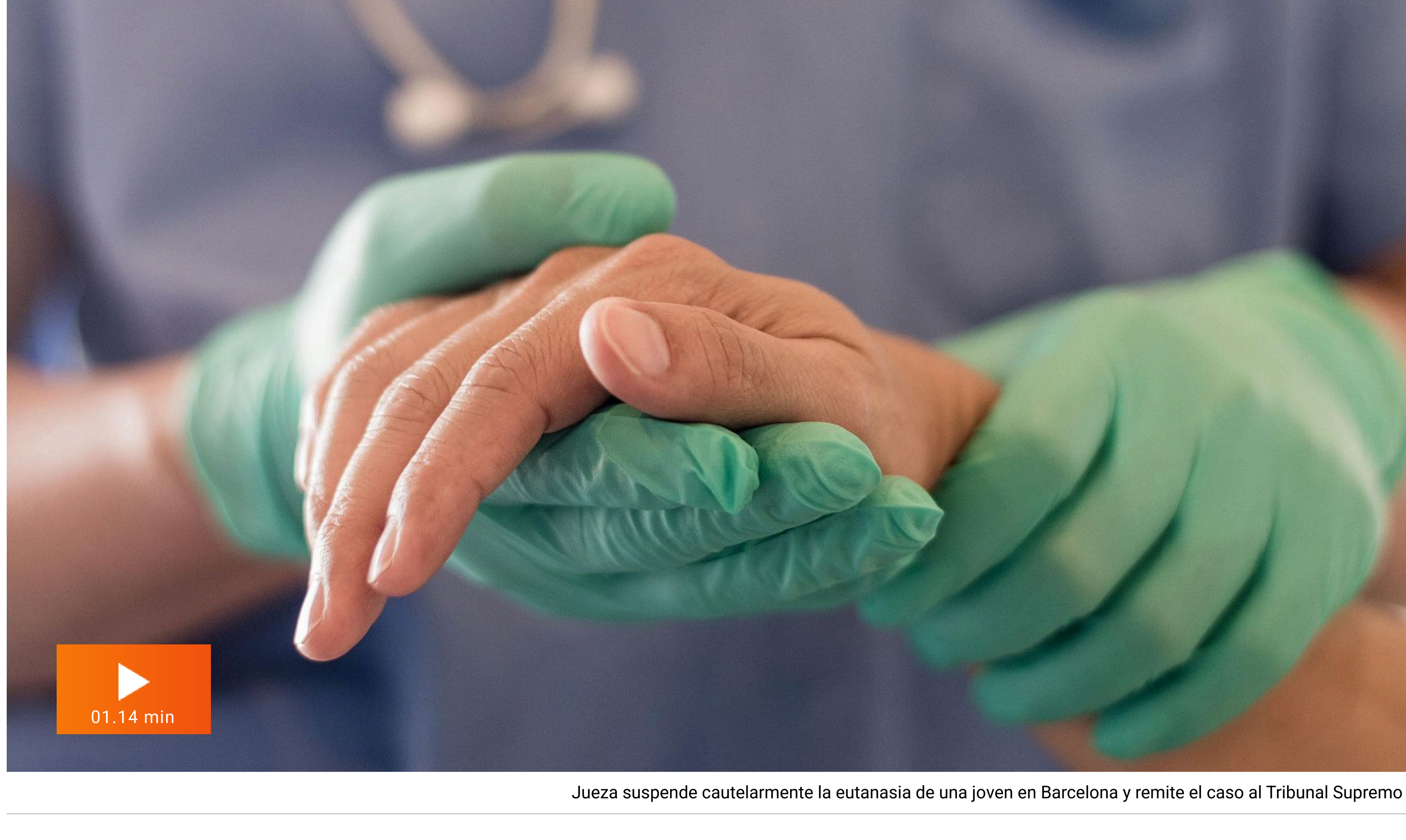
Jueza suspende cautelarmente la eutanasia de una joven en Barcelona y remite el caso al Tribunal Supremo