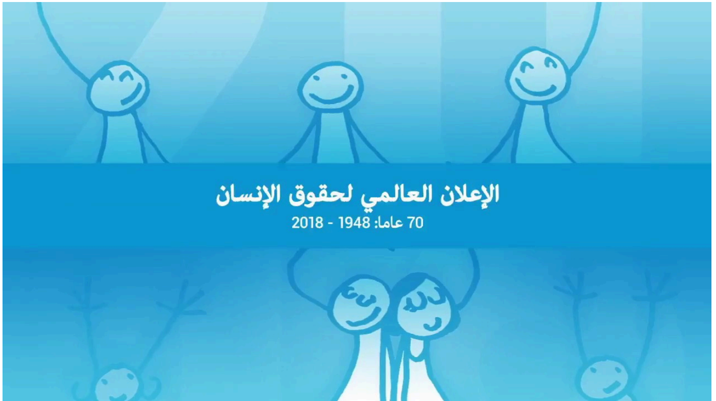
UN Messengers of PeaceEnglishCollection of Articles2018-8-6T:00:00:00+00:00