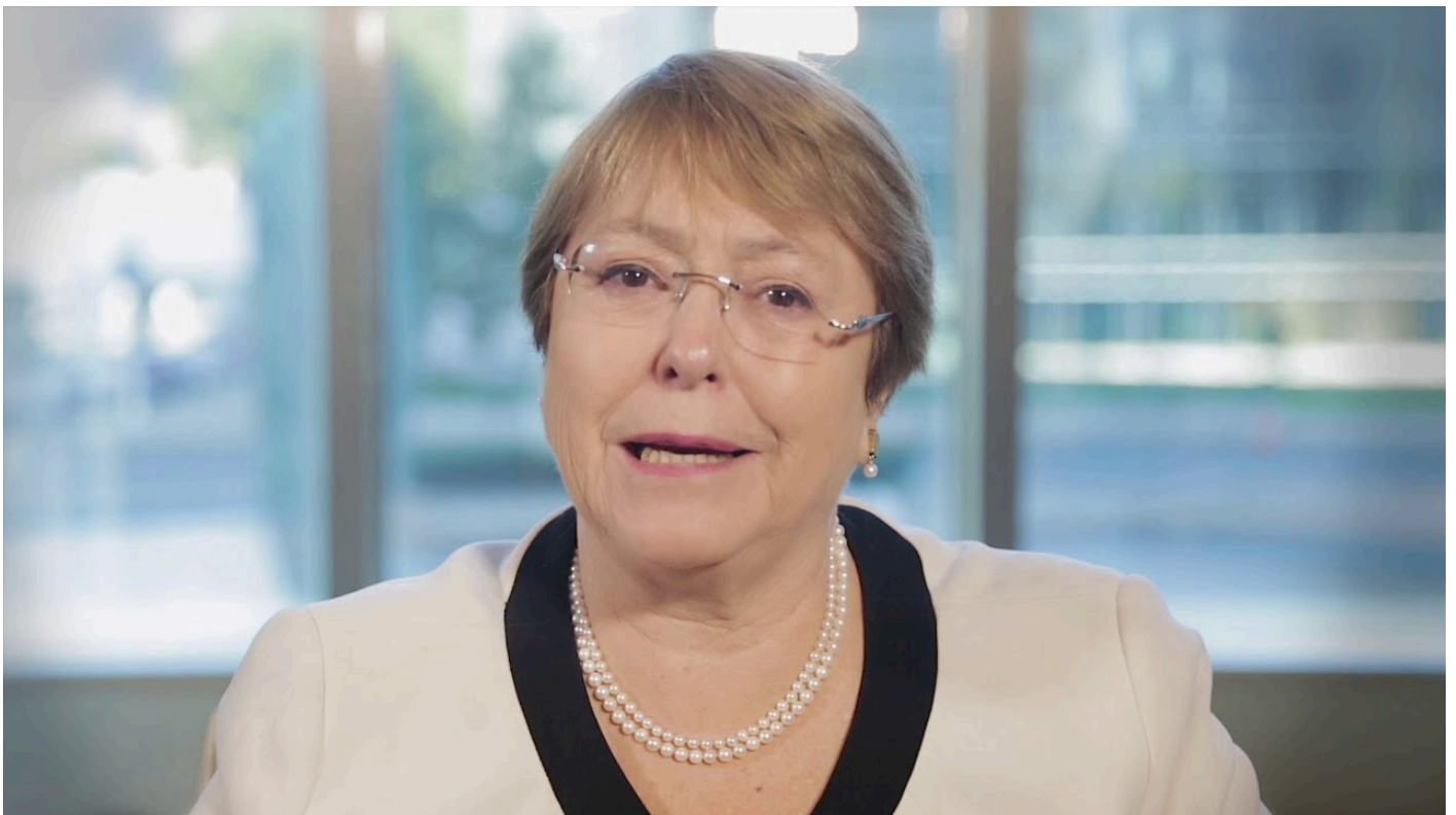
Michelle BacheletSpanish (Español)7Chile2018-10-18T:00:00:00+00:00