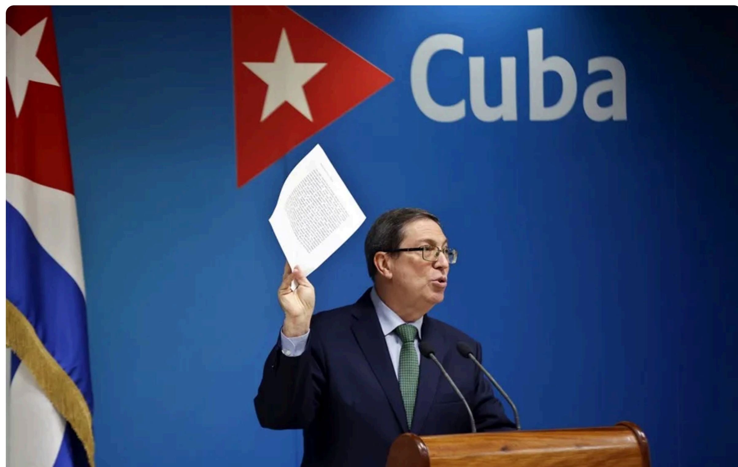
El canciller de Cuba, Bruno Rodríguez, habla en la sede del Ministerio de Relaciones Exteriores (Minrex), este 22 de octubre, en La Habana (Cuba).