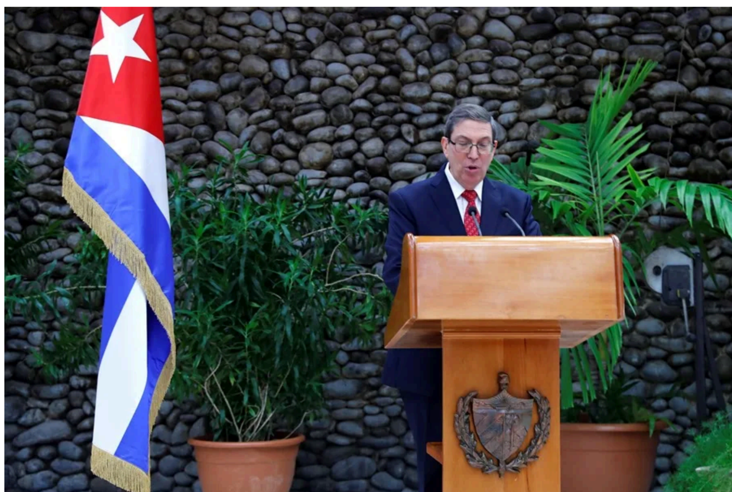
Fotografía de archivo del canciller de Cuba, Bruno Rodríguez.

De acuerdo con el canciller, EE.UU. ha intentado en las últimas semanas «coaccionar» a países aliados a través de mecanismos como «privación de visados» o «tarifas comerciales (aranceles)» o repercusiones «entre sus compañías privadas».